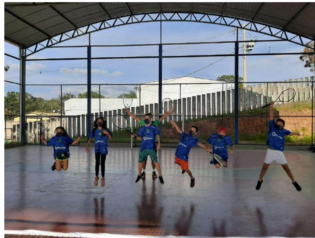
Projeto Saque Cidadão – Tênis