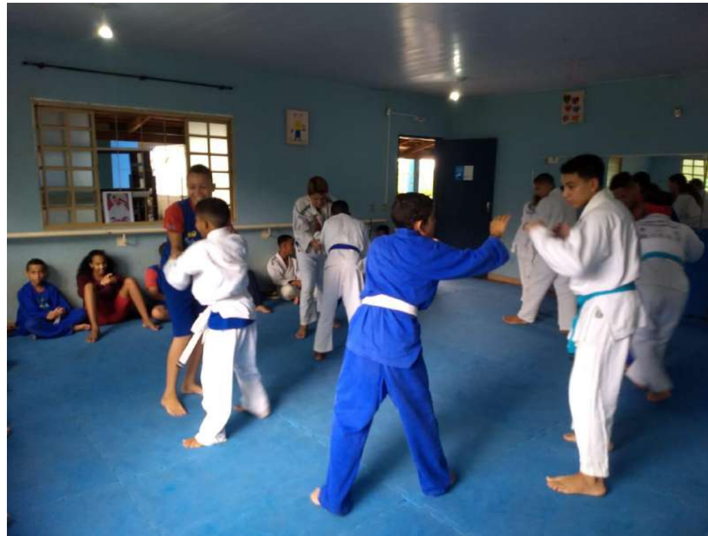
Projeto Esporte Transforma - Judô