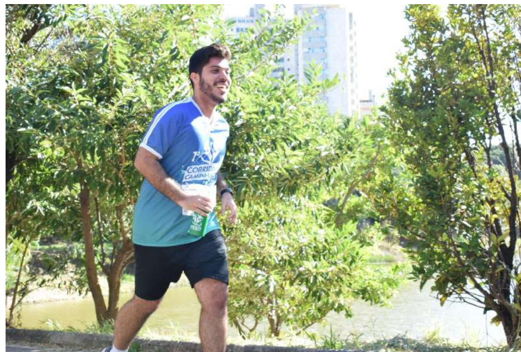
Corrida e Caminhada INEED