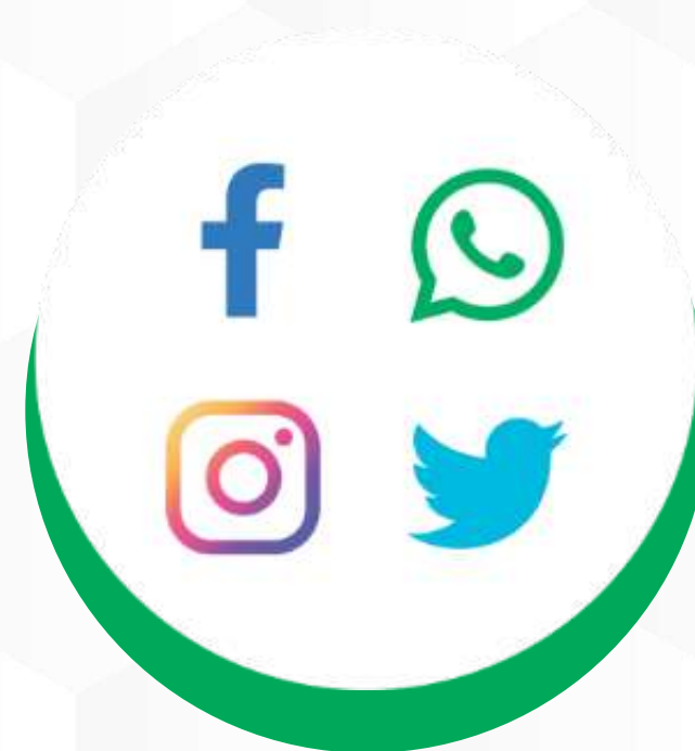
REDES SOCIAIS E SITE INSTITUCIONAL