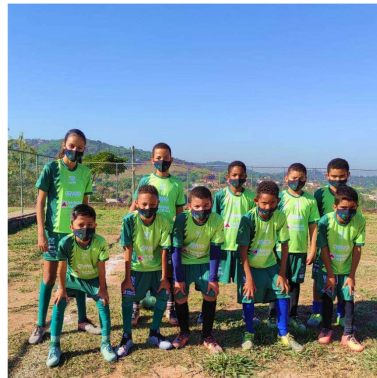
Projeto Esporte em Foco – Futebol de Campo